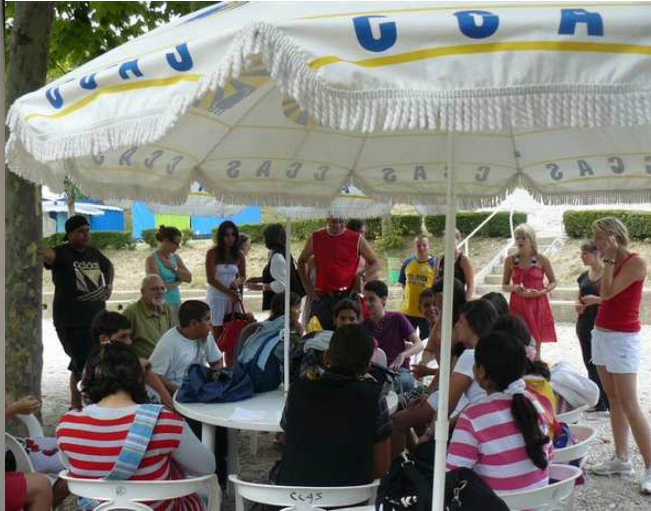
Le jour de leur arrivée à la Palud Sur Verdon