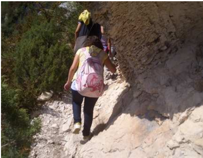
De la rando.....