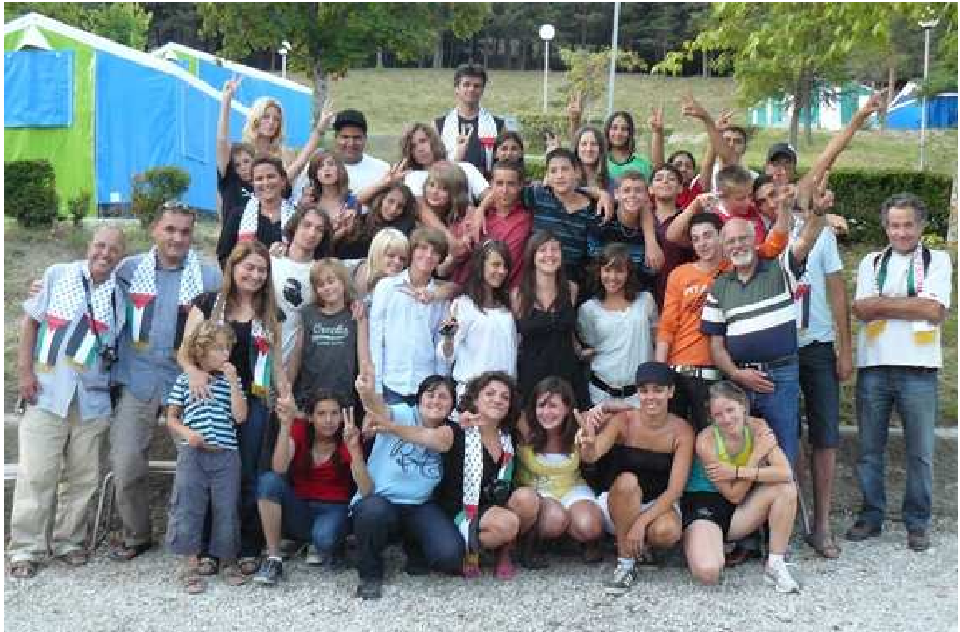
Le 14 août 2009 , nos jeunes ados Palestiniens et Français avec l'équipe presque au complet (Directeur, animateur-trices, accompagnateur-trices), organisateur-trices), partenaires, ami(e)s... et la Maire de La Palud, Conseillère générale)