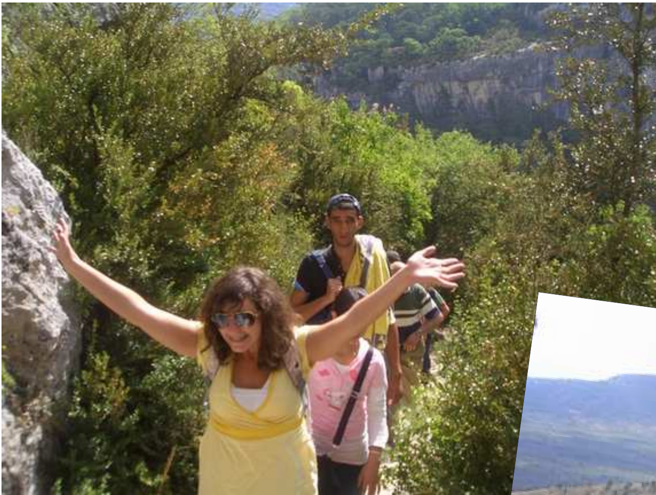
Libre et heureuse!