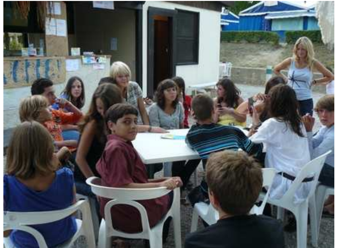
....au jeu de société